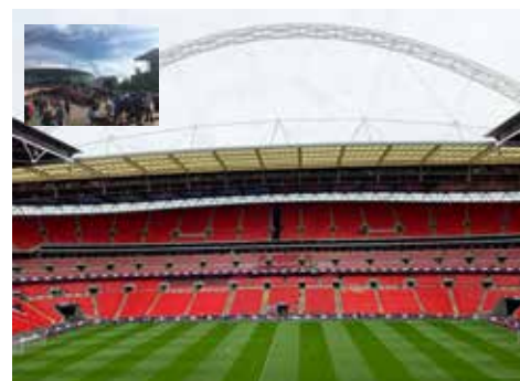
Vy från Centre Circle block 226