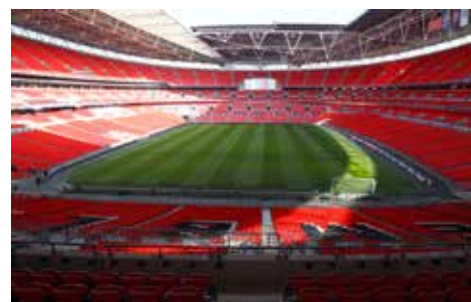
Vy från Inner Circle block 239