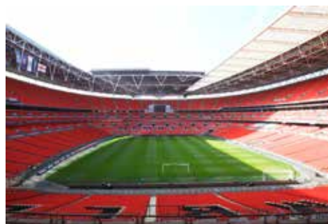
Vy från Inner Circle block 214