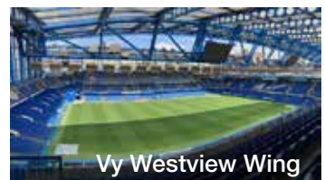
Vy Westview Wing